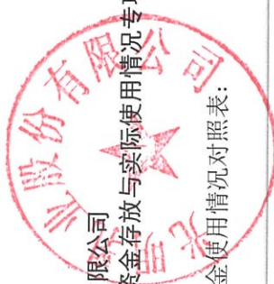
附表 1: 募集资金使用情况对照表: